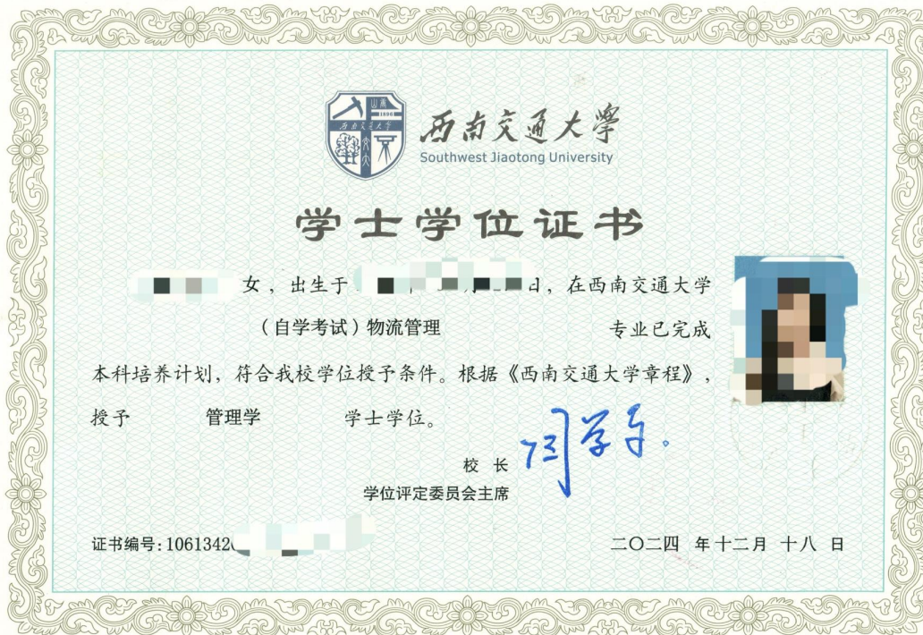
学士学位证书（样张）